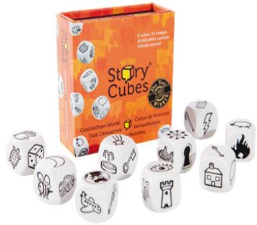
Ben's Story Cubes